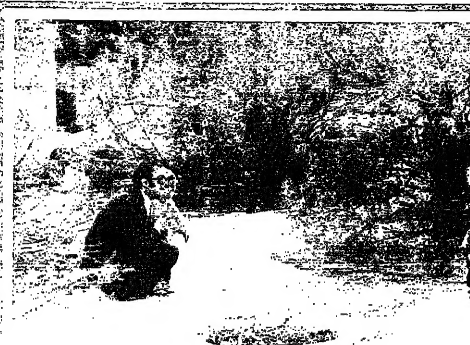
«الملك اند» امس كان نشطاً ساحلاً وجيلاً . الزهورات على الشواطئ عادت الى سابق عهدها مع جلسة عائلية وهوية وتربية . والزماجر عادت تطلق ابواقها مع موسم الاغراس . والاولاد وجندا في كل مكان مجالاً للعب والتسلية .

ينطلق الدكتور كورت فالداهم في جولته في الشرق الاوسط اليوم في مهمات حيوية تهدف الى جسر الشرق الاوسط وتقرير قريبا من سلام متفاوض عليه . وسيحاول الدكتور العام خلال محادثاته في القاهرة وبغداد وعمان بيروت والقنص ، تحقيق اتفاق على صيغة لاستئناف محادثات سلام في الشرق الاوسط فضل اجرائها في جنيف . وفي تقريبا سيجتمع الدكتور فالداهم في ١٢ شباط الى الرئيس القومي مكاريوس والسيد رؤوف نكاشا الزعيم القومي التركي «البيت في كيف يمكننا على افضل وجه الصبر شيا نحو تسوية للمشكلة القبرصية» . ويغادر الدكتور فالداهم نيويورك مساء اليوم الى جنيف حيث اعدت له الامم المتحدة طائرة خاصة لنقله الى جنيف . ومن المقرر ان يصل الى القاهرة يوم الاربعاء . وكانت الجمعية العامة للامم المتحدة قد اقرت في الشهر الماضي وبالجملة كيرة توصية تطالب فيها استئناف مؤتمر جنيف في وقت لا يتعدى ٢٠ اذار ولم يقد مؤتمر جنيف سوى ذبيرة واحدة عندما اجتمع لفترة قصيرة في كانون الاول عام ١٩٧٢ برعاية الامم المتحدة وبرئاسة الولايات المتحدة والاتحاد السوفياتي . وابلغ الدكتور فالداهم الصحفيين بعد مؤتمر صحفي اعلان فيه قراره توجهه في جولة في الشرق الاوسط بأنه يرى ان موعد اخر اذار سابق لواته . ولكنه اضاف يقول ان استئناف محادثات جنيف في الربيع احتمالي